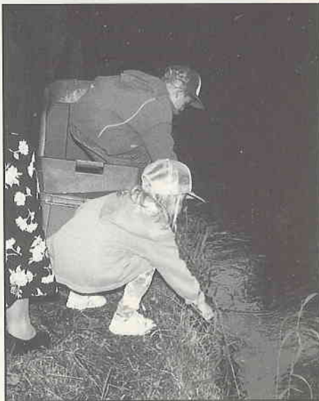
Un jeune parrain et une marraine lâchant délicatement les petits filleuls.

Un exposé sur la biologie du saumon, en faisant le lien avec la rivière Bruche et Saumon-Rhin leur a été proposé. En présence des élus locaux, enseignants, représentants associatifs et parents, chaque écolier a procédé concrètement à la mise à l'eau de «son» poisson, ce qui va permettre