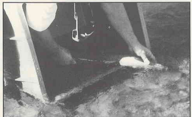
Le très médiatique saumon retrouve sa liberté dans un milieu favorable.