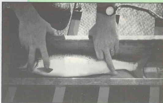
Mesure d'un saumon de souche Loire - Allier

Actuellement nous bénéficions d'un potentiel de 800 saumons atlantiques de souche Loire-Allier, la plus appropriée pour repeupler le bassin rhénan, répartis sur 4 sites.